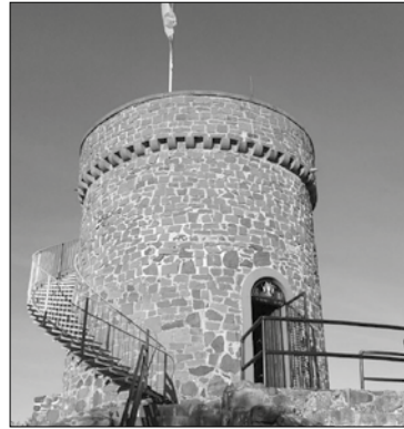
Die Liebenburg in Namborn

Der Jugendmigrationsdienst im Quartier (JMD-iQ) bietet in den Herbstferien, im Rahmen des 1200-jährigen Völklinger Stadtjubiläums, eine Mitmachausstellung zum Thema „Mittelalter“ an.