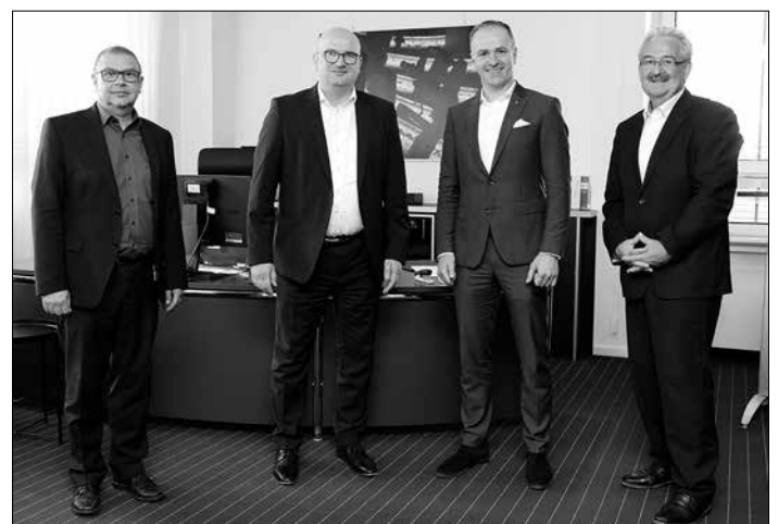
Gestalten gemeinsam die Transformation der Berufswelt