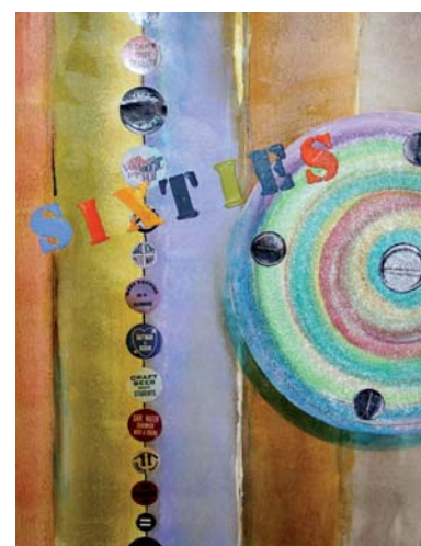
Eva Müller: „Sixties“ (Ausschnitt)