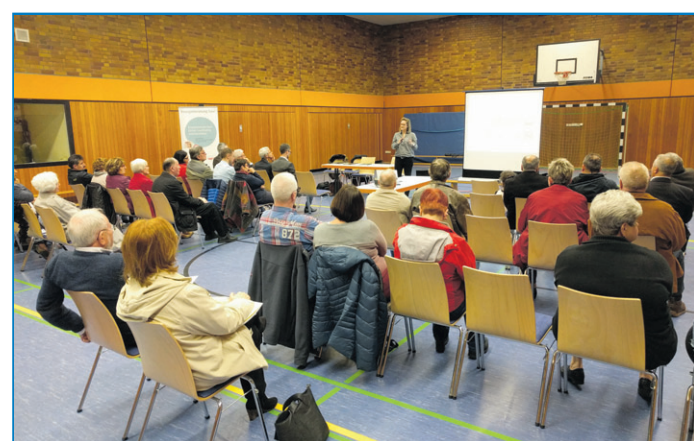
Bürgerinnen und Bürger zeigten großes Interesse am Thema energetische Sanierung

en Fischer bzw. telefonisch unter (06898) 13 2462 oder per e-Mail an doreen.fischer@voelklingen.de melden, die dann zu den passenden Stellen weitervermittelt. Als weiteren Anreiz, am eigenen Gebäude tätig zu werden, ist geplant, über das Förderprogramm "Soziale Stadt" das bereits in Wehrden und anderen Teilen der Innenstadt erfolgreiche Fassadensanierungsprogramm als stadteigenes Förderprogramm im Quartier der Nördlichen Innenstadt neu aufzulegen. Damit haben Bürger, deren Haus innerhalb des Fördergebiets liegt, die Möglichkeit, für die Verschönerung der Fassade eine finanzielle Förderung von bis zu 2.500 Euro zu erhalten. Vielleicht ergibt sich daraus der Einstieg in eine weitergehende energetische Sanierung von Haus und Anlagentechnik als Beitrag zum Klimaschutz. Bevor Oberbürgermeister Klaus Lorig die Veranstaltung schloss, überreichte er fünf Gutscheine für die Erstellung eines Gebäudeenergieausweises an die, aus den Teilnehmern der Fragebogenaktion ermittelten Gewinner. Zwei Gewinner konnten den Gutschein mit einem Gegenwert von 400 Euro bis 700 Euro direkt entgegennehmen; den drei nicht anwesenden Gewinnern wird dieser zugestellt.