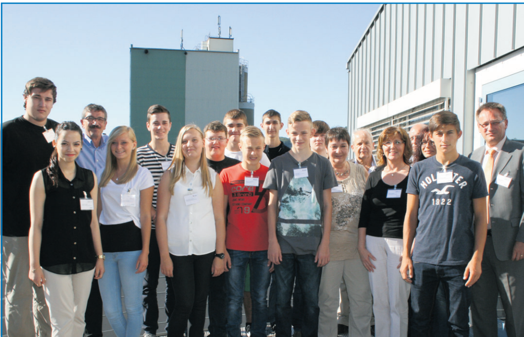
Berufsstart bei den Völklinger Stadtwerken

Die Stadtwerke werden auch im Jahr 2014 Auszubildende und Praktikanten einstellen. Wer eine von den begehrten Stellen haben möchte, kann sich bereits heute bewerben. Stadtwerke Völklingen Holding GmbH, Personalabteilung, Hohenzollerstraße 10, 66333 Völklingen.