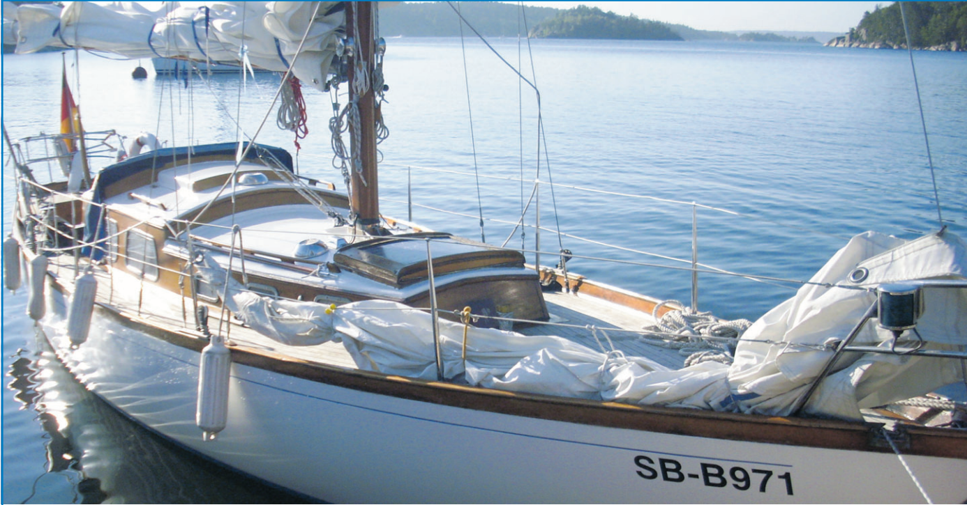
Mittsommer auf dem eigenen Boot in Schweden – ein Traum, den man sich erfüllen kann! Die Bootsfahrschule Poseidon, bietet seit 13 Jahren in Zusammenarbeit mit der Volkshochschule Völklingen Kurse zum Erwerb des Sportbootführerscheins an. Ein Informationstreffen findet am Freitag, 6. September, 18 Uhr im alten Rathaus statt. Nähere Informationen erhalten Sie unter Telefon: 06898 13 - 25 97.

Am Freitag, 30. August, ist es wieder soweit. Das nächste Konzert der beliebten Simschel Open-Air Reihe steht an. Die Stadtwerke Völklingen laden ihre Kunden zu einem außergewöhnlichen Showabend ins Wasserwerk Simschel ein. Ab 19.30 Uhr wird das Gunni Mahling Showensemble, das aus 15 stimmungsvollen Sängerinnen und Sängern und sechs Tänzerinnen und Tänzern besteht, weltbekannte Melodien aus Rock und Pop zum Besten geben. Am Konzerttag sorgt das Team des Wasserwerk Simschel für das leibliche Wohl der Besucher. Bei schlechtem Wetter findet das Konzert in den Innenräumen des Wasserwerks statt. Der Eintritt ist frei.