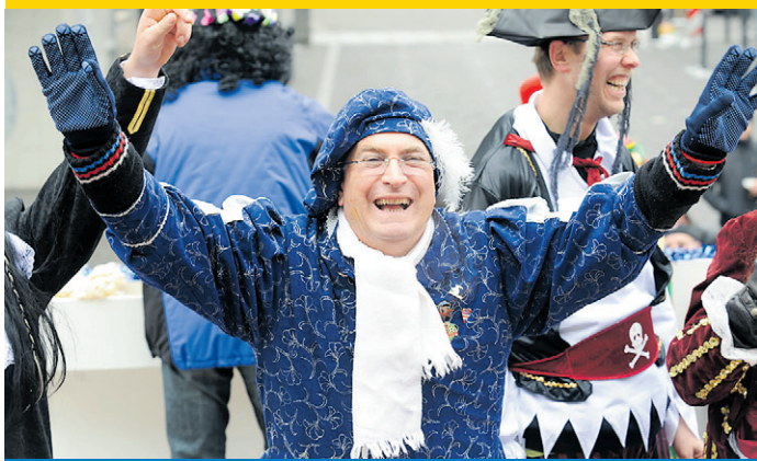
RATHAUSCHEF IN ROSENMTAGSLAUNE