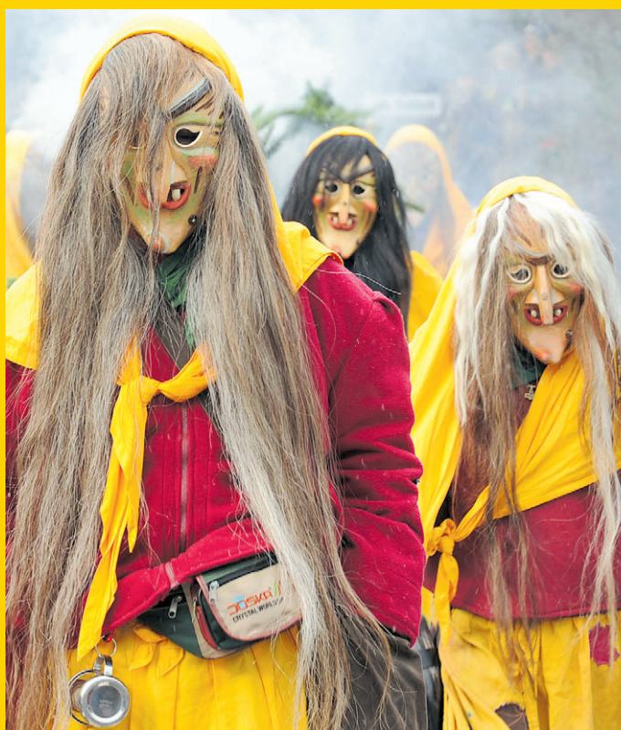
HEXENTANZ IN LUDWEILER