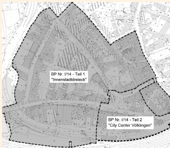
Kartenausschnitt mit Genehmigung des LKVK: B/004/86