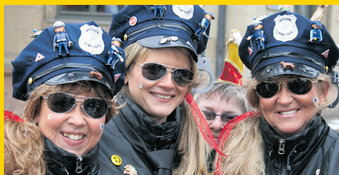
LAUTER HAPPY HIPPOS