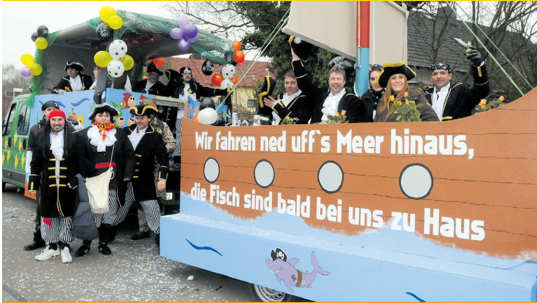
FISCHBEKENNTNIS AUF DEM HEIDSTOCK