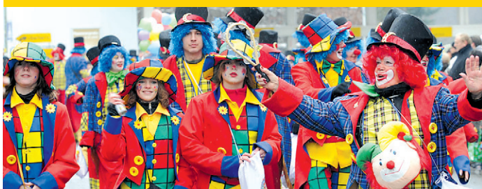
AUFMARSCH DER CLOWNS