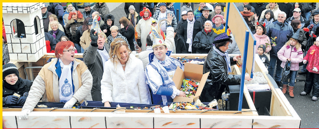
NACHLADEN FÜR BONBON-BOMBARDEMENT